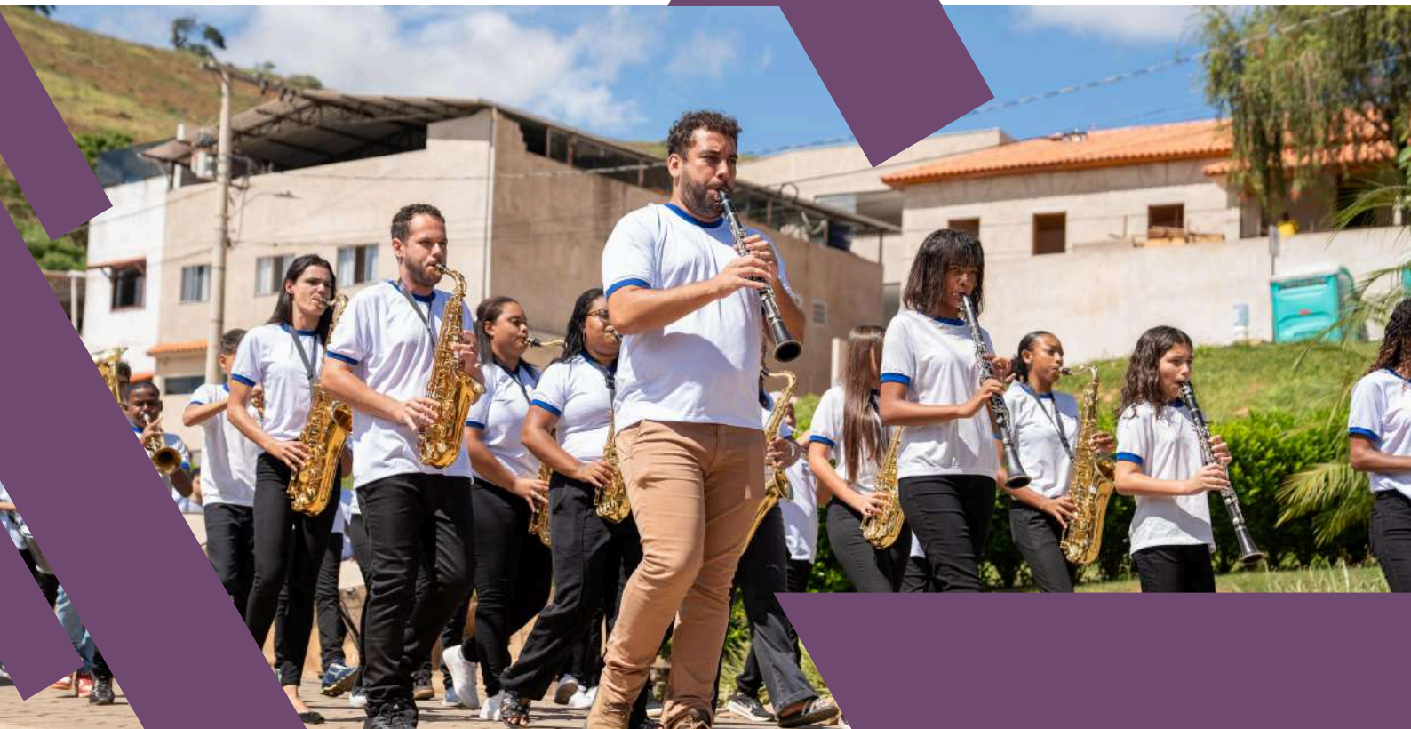
Apresentação cultural - Projeto Semeando Saberes - 2025 Público Alvo: crianças, adolescentes e jovens