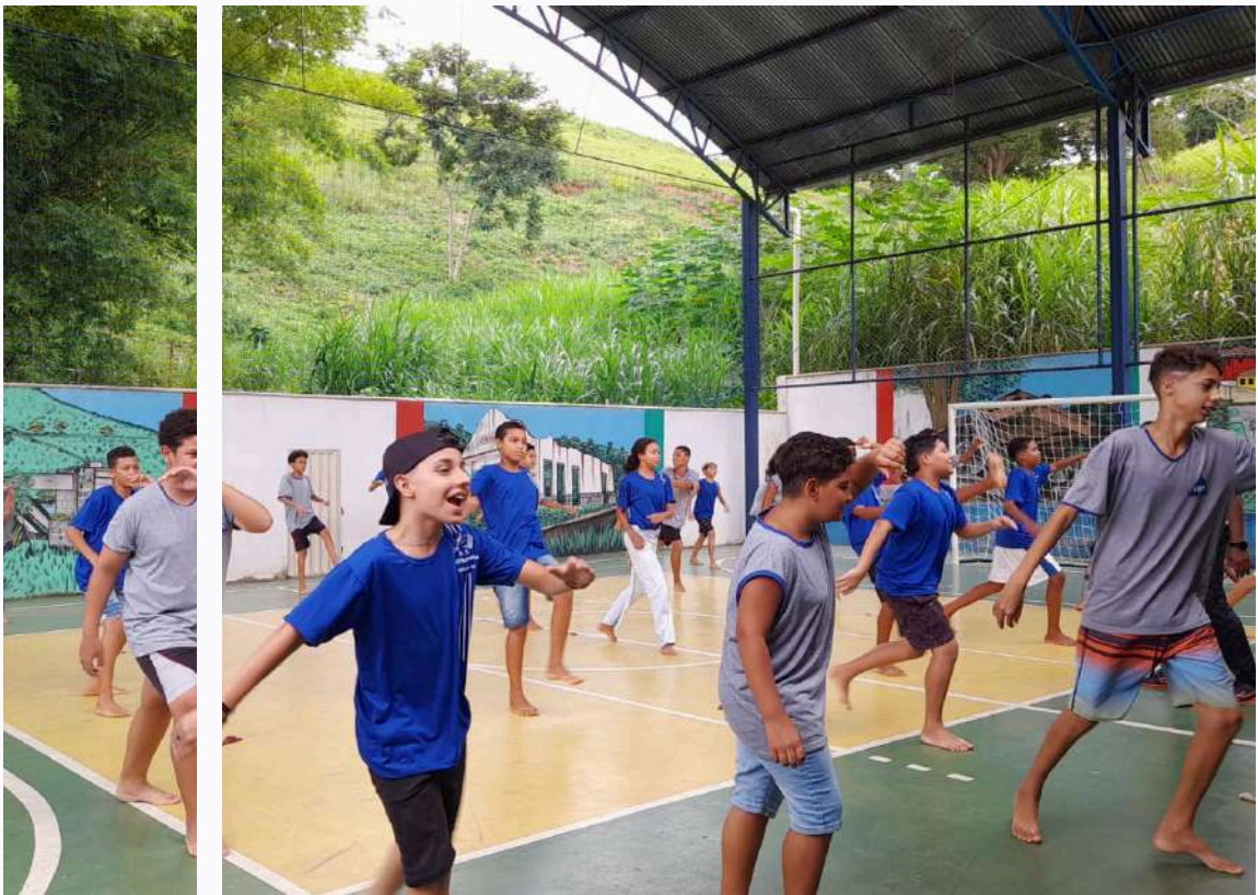
Oficina de capoeira ministrada na Escola Estadual Maria Amélia Público Alvo: Crianças, jovens e adolescentes

Nossa atuação em relação ao assessoramento de organizações e coletivos se dá por meio de programas estruturados que compreendem: capacitações, treinamentos e oficinas; elaboração de propostas estratégicas; implementação de iniciativas; assessoramento e monitoramento de indicadores. Nosso trabalho possibilita que organizações tenham mais acesso a oportunidade e consigam a desenvolver ações com mais efetividade e longevidade.