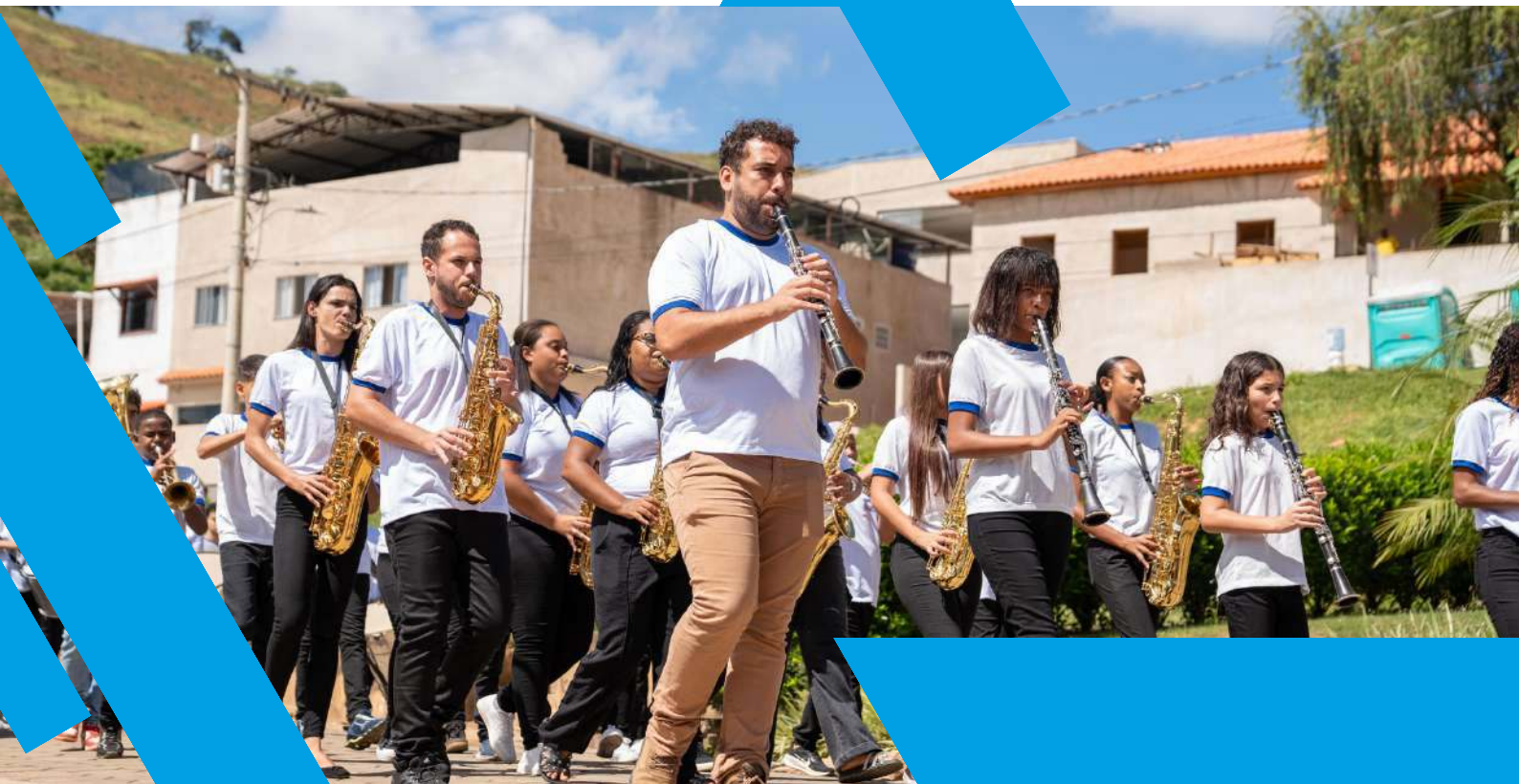
Apresentação cultural - Projeto Semeando Saberes - 2025 Público Alvo: crianças, adolescentes e jovens