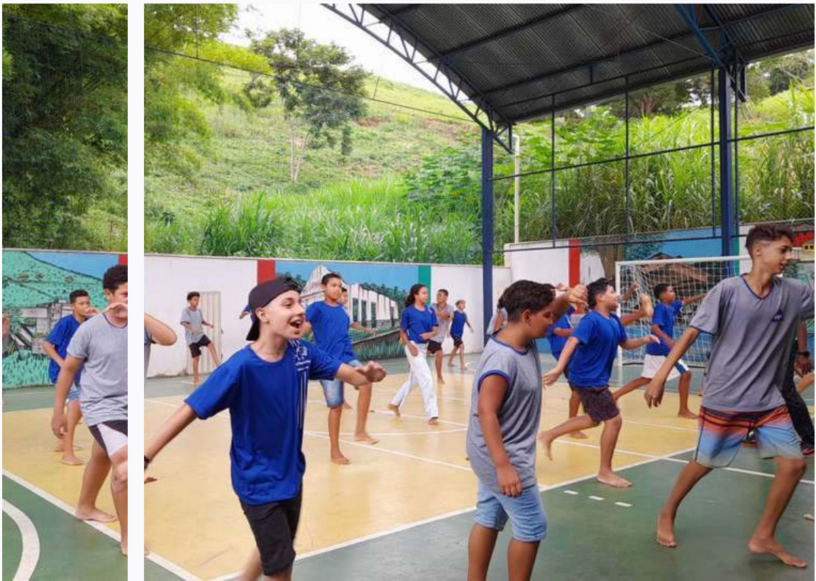
Oficina de capoeira ministrada na Escola Estadual Maria Amélia Público Alvo: Crianças, jovens e adolescentes

Nossa atuação em relação ao assessoramento de organizações e coletivos se dá por meio de programas estruturados que compreendem: capacitações, treinamentos e oficinas; elaboração de propostas estratégicas; implementação de iniciativas; assessoramento e monitoramento de indicadores . Nosso trabalho possibilita que organizações tenham mais acesso a oportunidade e consigam a desenvolver ações com mais efetividade e longevidade.